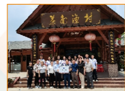
兴宁叶南渔村创新创业实践班