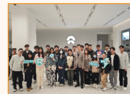
师生走访佛山蔚来汽车公司