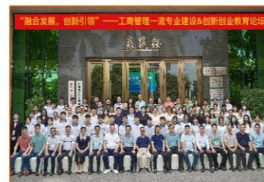
融合发展 创新引领 工商管理一流专业建设&创新创业教育论坛