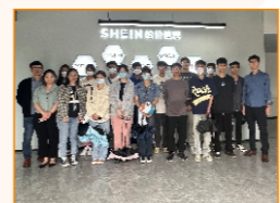
到广州希音供应链公司交流学习