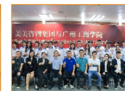
与美云美服科技有限公司校企联培班开班仪式（2023级）