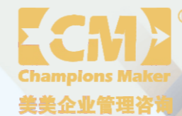
Champions Maker 美美企业管理咨询