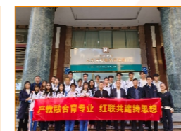
与广东省人力资源研究会校企联培班开班仪式（2023级）