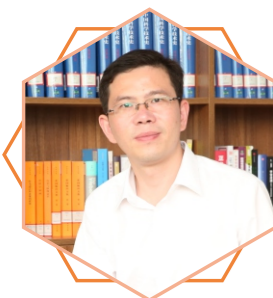
侯治平 教授、南京大学博士 工商管理专业负责人