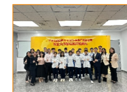
与中外运-敦豪广东分公司校企联培班开班仪式（2023级）