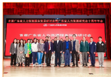
学院师生参加《首届广东省人力资源服务贸易研讨会暨广东省人力资源研究会十周年年会》