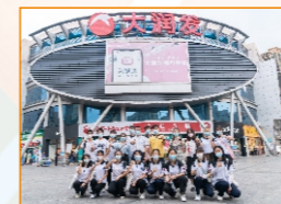
师生到大润发参观